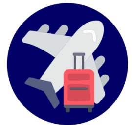
Viajar por placer

Entre otros están jugar videojuegos, leer libros impresos, ir a fiestas con amigos y practicar deportes. Estos hábitos son similares en América como en Perú.